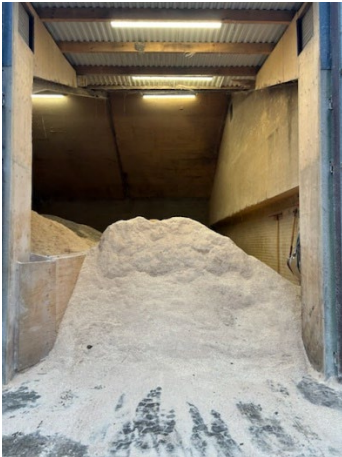
Et læs savsmuld på lageret