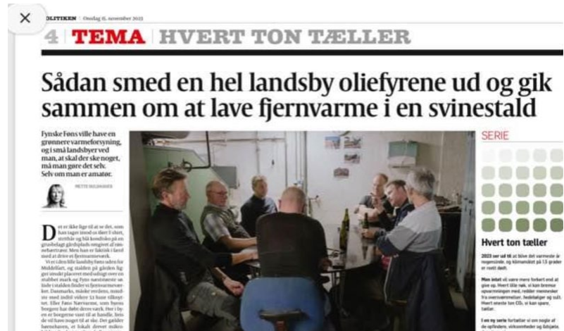
Artikel i POLITIKEN d. 15. november

Igen i år har Føns Nærværme været eksponeret i forskellige sammenhænge. Vi har haft flere fremvisninger af værket i årets løb og var med i en af debatterne på klimatopmødet omkring 1. september. Endvidere omtalte Politiken Føns Nærværme i et par artikler i november, så vi er ved at blive kendt i det ganske land.